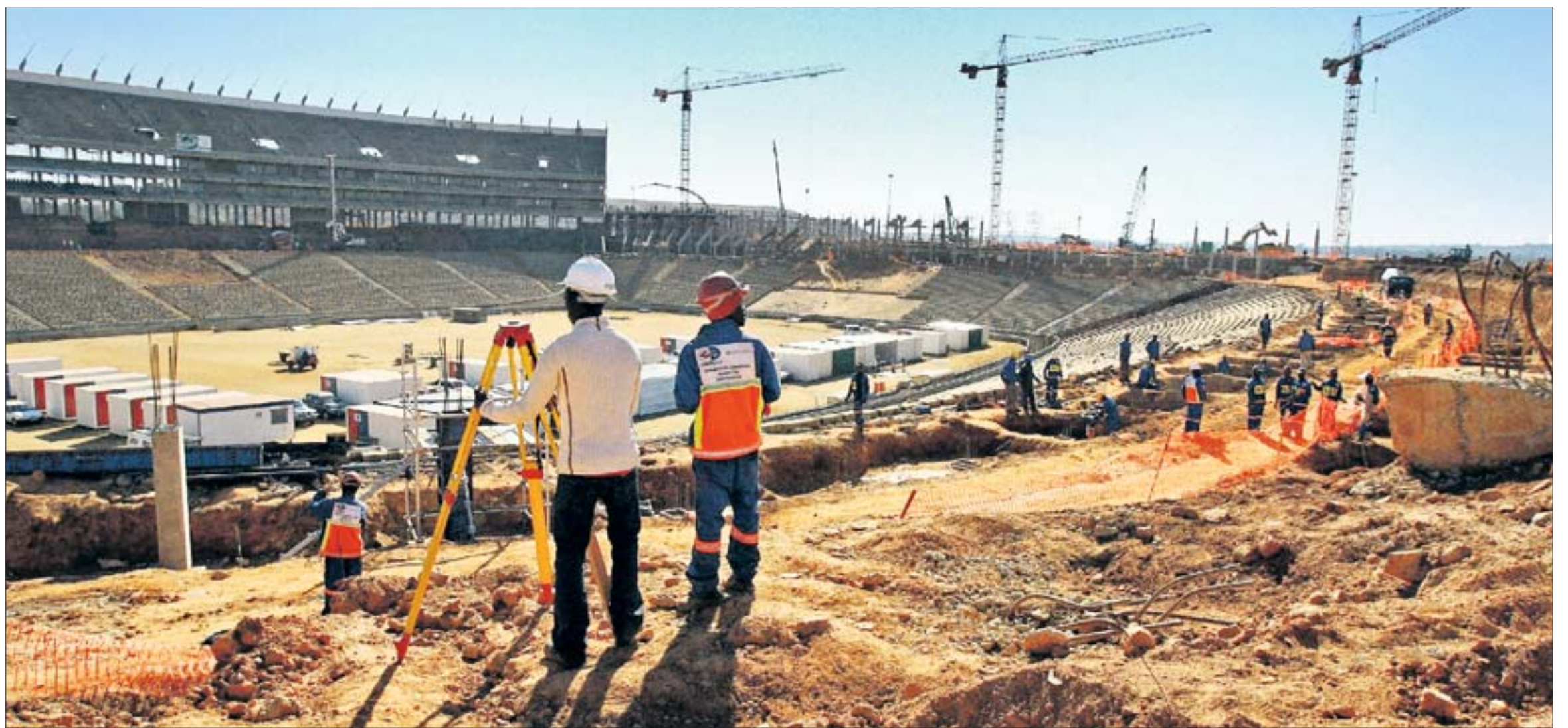
Große Pläne, große Mühe: Aus dieser Baustelle soll einmal das neue Stadion „Soccer City“ in Johannesburg werden, die größte Arena der WM 2010. Es bleibt viel zu tun bis zum Eröffnungsspiel, und längst läuft nicht alles reibungslos.