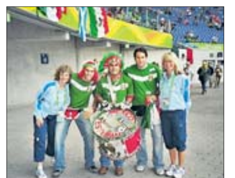
„Als Volunteer im Pressezentrum durfte ich die WM live im Stadion Hannover erleben. Die Atmosphäre vor den Spielen, das Eintreffen der begeisterten Fans, das Einlaufen der Teams, die verschwitzten Spieler und Trainer in der Pressekonferenz, das Volunteer-Team mit unterschiedlichsten Menschen aus so vielen Nationen – es gibt so viele Erinnerungen, dass sie ganze Bücher füllen würden!“