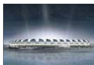
PORT ELIZABETH STADIUM Port Elizabeth

Benannt nach dem Volk der Bafokeng, die im Gebiet rund um Rustenburg leben. Einen Erstligaklub gibt es nicht, geplant als Arena für den Konföderationen-Cup 2009. Baujahr: 1999 Fassungsvermögen: 46 000 Baumaßnahmen: Geringfügiger Ausbau Fertigstellung: Dezember 2008