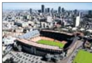
ELLIS PARK STADIUM Johannesburg

Die Heimat des südafrikanischen Fußballs – das erste Nationalstadion des Landes und WM-Hauptstadion. Die einzigartige Fassade erinnert an einen afrikanischen Tontopf. Baujahr: 1987 Fassungsvermögen: 95 000 (derzeit 80 000) Baumaßnahmen: Komplettneuerung Fertigstellung: 2010