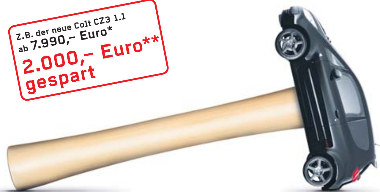
Abb. Colt CZ3 „Remix“

Z.B. der neue Colt CZ3 1.1 ab 7.990,- Euro* 2.000,- Euro** gespart