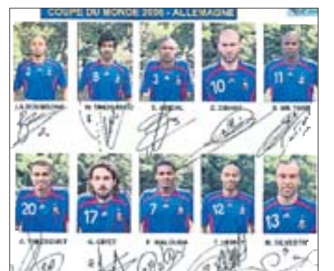
Ganzer Stolz: Auf dem Plakat mit den Nationalspielern fehlt kein einziges Autogramm.