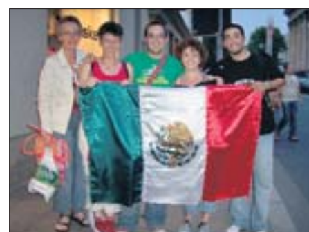
Fahne zu schwenken und ‚Mexiko‘ zu rufen. Das war schon ein Spaß, denn unsere Rufe wurden wohlwollend beantwortet.

Wir dachten an den unglücklichen Menschen, der ohne seine Landesfahne dem Spiel beiwohnen würde. Die Stimmung in Hannover war unwerfend – die Mexikaner warmherzig, freundlich, ausgelassen! Das gefiel uns, und für uns war klar, dass wir am nächsten Tag für Mexiko sein würden. Wir ließen es uns nicht entgehen, immer wenn Mexikaner vorbeikamen, die