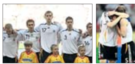
Anfang und Abschluss: Per Mertesacker vor dem WM-Eröffnungsspiel (v.l.) und bei der Fanparty am Brandenburger Tor.

Nutzt man all diese schönen Erlebnisse, wenn es einem nicht gut geht? Frankreich WM-Dritter geworden – damit stehen wir im Kreis der Länder, die EM-Favorit sind. Nach der WM mussten wir uns auch damit auseinandersetzen.