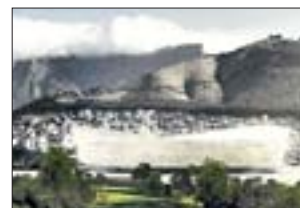
GREEN POINT STADIUM Kapstadt

Ersetzt das abgerissene King's-Park-Stadion an gleicher Stelle, das Austragungsort des ersten Spiels der südafrikanischen Nationalmannschaft nach dem Ende der Apartheid war (1:0 gegen Kamerun). Baujahr: 1906 Fassungsvermögen: 70 000 Baumaßnahmen: Neubau Fertigstellung: Oktober 2009