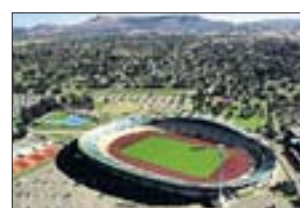
ROYAL BAFOKENG SPORTS PALACE Rustenburg

Heimstadion des mehrfachen Landesmeisters Mamelodi Sundowns und geplant als Austragungsort für den Konföderationen-Pokal 2009. Baujahr: 1906 Fassungsvermögen: 50 000 (derzeit 45 000) Baumaßnahmen: Ausbau, Modernisierung Fertigstellung: Dezember 2008