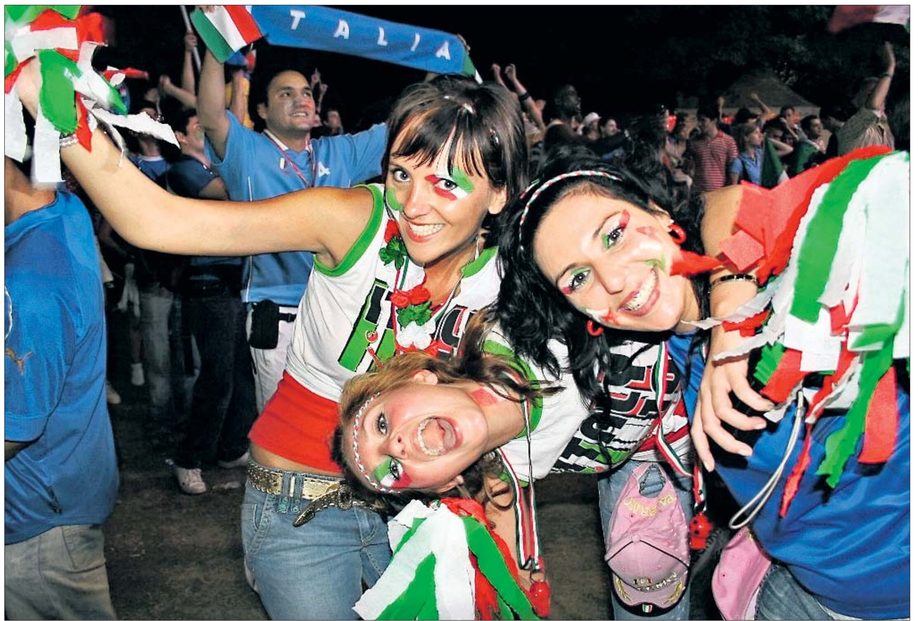
Weltmeister auch im Feiern: Hans-Werner Burgdorff fotografierte fröhliche italienische Fußballfans – lange vor dem Finale in Berlin.