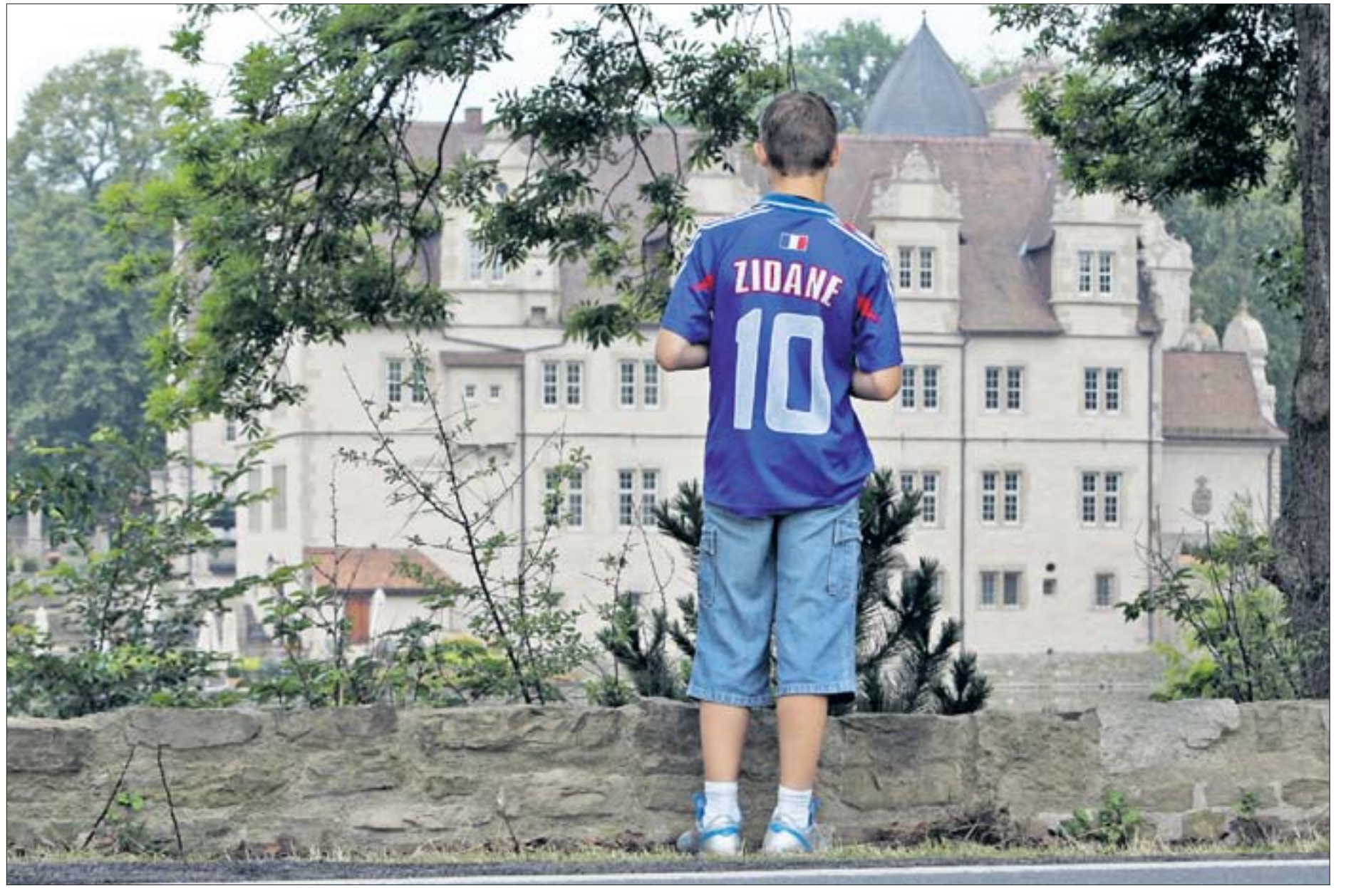
Fans von Zinedine Zidane müssen das Schlosshotel Münchhausen nicht mehr aus sicherer Entfernung beobachten wie während der WM. Heute können sie im damaligen Bett ihres Idols schlafen.