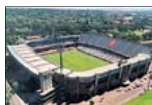
LOFTUS VERSFELD STADIUM Pretoria

In der Provinz Limpopo, in der Polokwane liegt, gibt es die meisten angemeldeten Fußballer aller Provinzen. Das Stadion ist nach Peter Mokaba benannt, einem politischen Aktivist zu Zeiten der Apartheid. Fassungsvermögen: 46 000 Baumaßnahmen: Neubau Fertigstellung: Oktober 2009