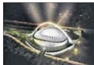
DURBAN STADIUM Durban

Heimstätte des Premier-League-Klubs Orlando Pirates FC und Schauplatz des Rugby-WM-Endspiels 1995. Geplant als Spielort beim Konföderationen-Pokal 2009. Baujahr: 1982 Fassungsvermögen: 60 000 Baumaßnahmen: kleinere Umbauarbeiten Fertigstellung: Dezember 2008