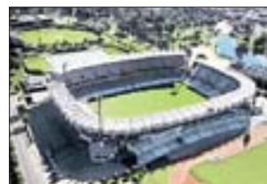
FREE STATE STADIUM Bloemfontein

Der Neubau liegt in Kapstadts Vorort Green Point, nur einen Steinwurf vom Ozean entfernt. Noch wird das Gelände von einem Golf-Klub benutzt. Fassungsvermögen: 70 000 Baumaßnahmen: Neubau Fertigstellung: Oktober 2009