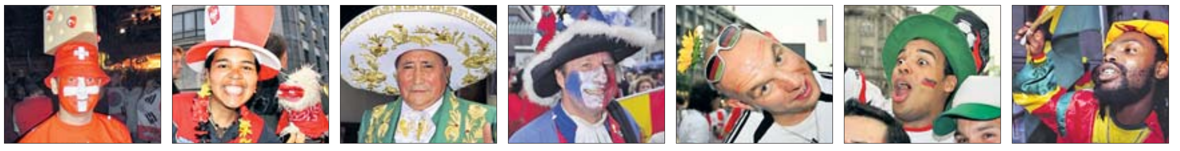
Alles Käse: Ein Schweizer Fan, fotografiert von Klaus-Jürgen Schirmer. WM international: Gesehen von Hans-Werner Burgdorff. Der schönste Hut von Mexiko, fotografiert von Hans-Jürgen Schulte. Vive la France, gesehen von Hans-Jürgen Schulte. Deutschland blüht auf, fotografiert von Hans-Werner Burgdorff. Große Augen, großer Spaß, eingefangen von Hans-Werner Burgdorff. Ghana tanzt, festgehalten von Hans-Jürgen Schulte.