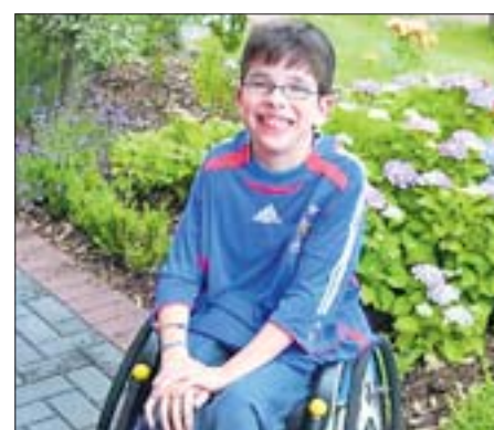
Hektik, die Adressen auszutauschen, um uns nochmals bedanken und gegebenenfalls in Kontakt bleiben zu können.

Völlig überrascht und überwältigt von der Geste waren wir beide. Wir klatschten ab, jubelten, bedankten uns aufs Herzlichste und wünschten unseren ‚Freunden‘ alles Gute. Leider vergaßen wir in der