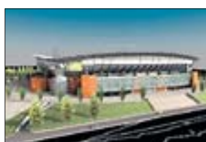
PETER MOKABA STADIUM Polokwane

Wie passend: Mbombela ist ein Wort aus der siSwati-Sprache und bedeutet wörtlich „viele Menschen zusammen auf kleinem Raum“. Nationalparks liegen ganz in der Nähe. Fassungsvermögen: 46 000 Baumaßnahmen: Neubau Fertigstellung: Oktober 2009