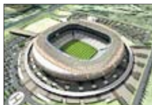
SOCCER CITY STADIUM Johannesburg

Die Heimat des südafrikanischen Fußballs – das erste Nationalstadion des Landes und WM-Hauptstadion. Die einzigartige Fassade erinnert an einen afrikanischen Tontopf. Baujahr: 1987 Fassungsvermögen: 95 000 (derzeit 80 000) Baumaßnahmen: Komplettneuerung Fertigstellung: 2010