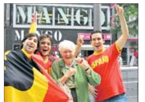
„Am ersten Tag der WM war ich in der Stadt unterwegs und fand es so schön, dass ich danach immer meinen Fotoapparat mitgenommen habe. Jedes Mal, wenn in Hannover ein Spiel war, bin ich dann vom Bahnhof zum Stadion gelaufen und habe Bilder gemacht. Die Gruppe Spanier wollte ich eigentlich nur fotografieren, aber sie meinten, ich müsste mit auf Bild. Also hat einer von ihnen ein Foto mit meiner Kamera gemacht. So ist dieses Bild entstanden.“