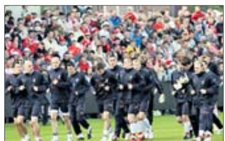
Ausläufer: Polen trainierte in Barsinghausen.

Das wird sich am 13. November vor dem Spiel der deutschen Elf gegen Zypern ändern. Es wird ein Heimspiel. stk