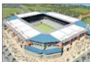
MBOMBELA STADIUM Nelspruit

Heimstätte des Erstligaklubs Bloemfontein Celtic in der Provinz Free State – daher der Name. Geplant als Spielort für den Konföderationen-Cup 2009. Baujahr: 1952 Fassungsvermögen: 46 000 (derzeit 37 160) Baumaßnahmen: Modernisierung, Ausbau Fertigstellung: Dezember 2008