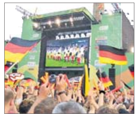
tanzten auf den Straßen. So etwas vermag wohl nur der Fußball zu vollbringen.

Wenige Sekunden später ertönte unter dem ohrenbetäubenden Jubelgeschrei der Fans der Schlusspfiff. Pudelnass, aber glücklich machte ich mich auf den Heimweg. Was war das gegen Mitternacht für eine Stimmung in Hannover! Der Jubel wollte kein Ende nehmen. Überall zogen fröhliche Menschen friedlich durch die City, sangen, nahmen sich in die Arme, schwangen ihre Deutschlandfahnen und